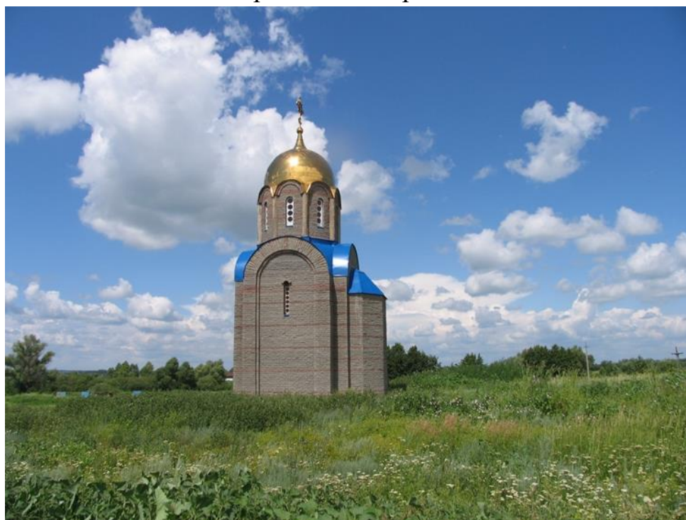
Часовня на берегу Святого озера.

Ресурсы о регионе и районе маршрута, ссылки