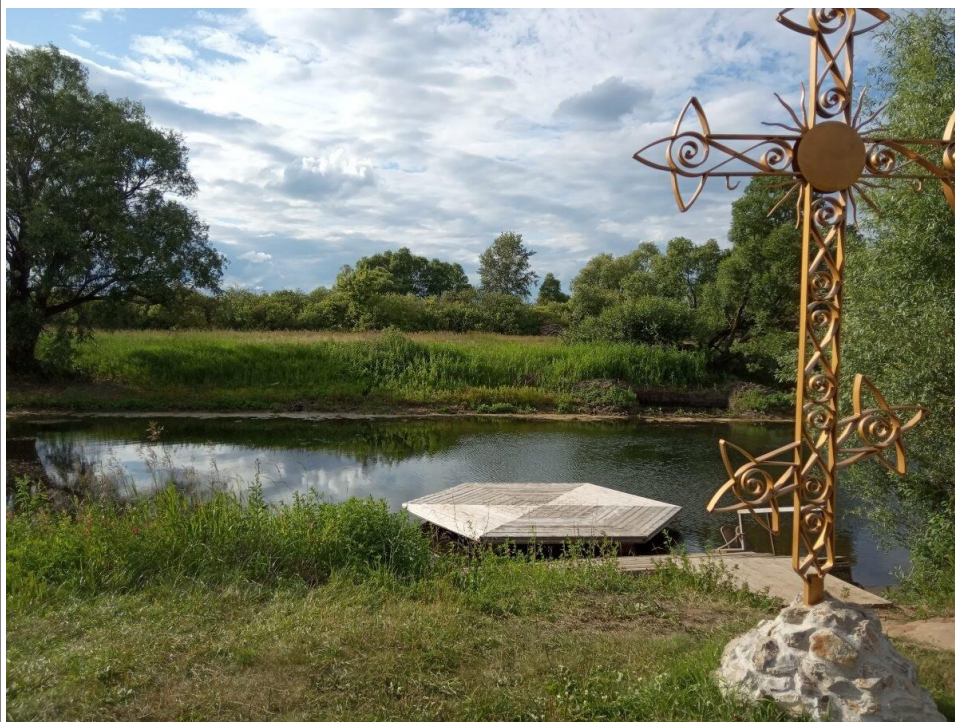
Святое Казанско-Богородичное озеро.