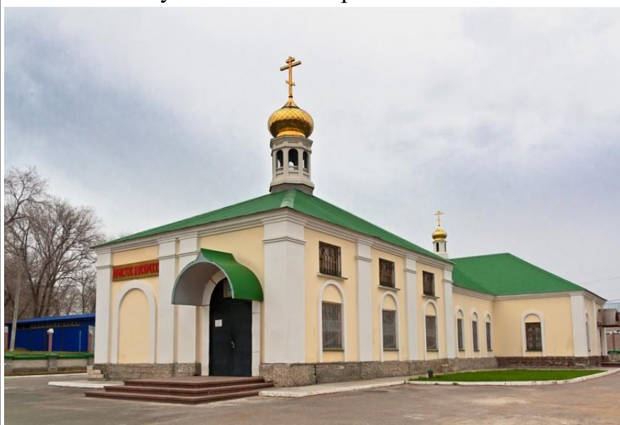
Никольский храм, где хранится чудотворная икона Святителя