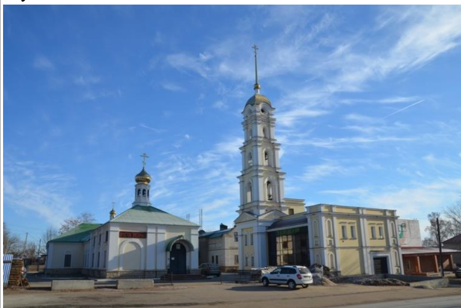
Никольский мужской монастырь.