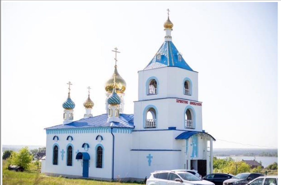
Церковь Покрова Пресвятой Богородицы в с. Беловка